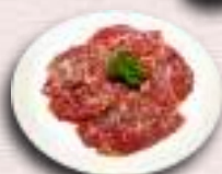
にんにく塩ハラミ