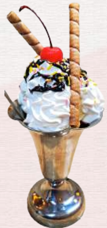
チョコレートパフェ