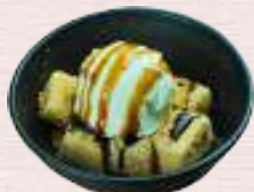
バニラとわらび餅