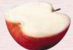
りんごシャーベット