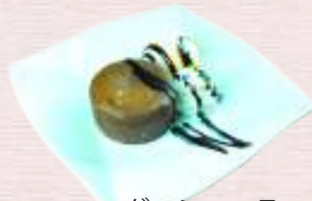
フォンダンショコラ