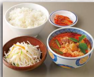
カルビスープセット