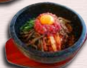
石焼きユッケビビンバ