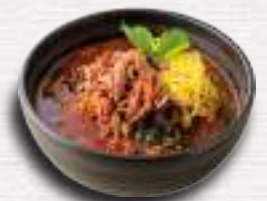
ユッケジャンスープ