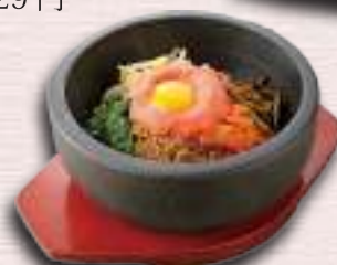
石焼き明太ビビンバ