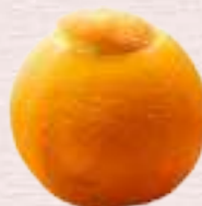
オレンジシャーベット