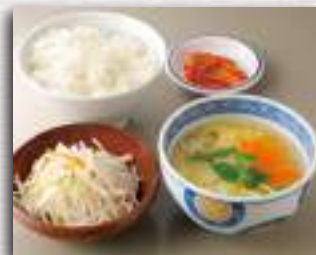
玉子スープセット