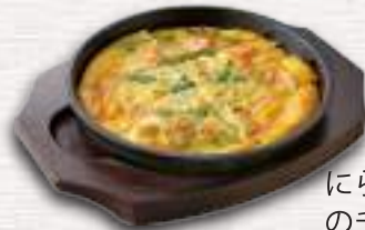
にらと海鮮のチヂミ