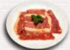
にんにく塩カルビ