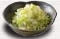
味ネギ 231 円