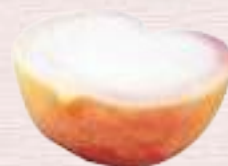
ももシャーベット